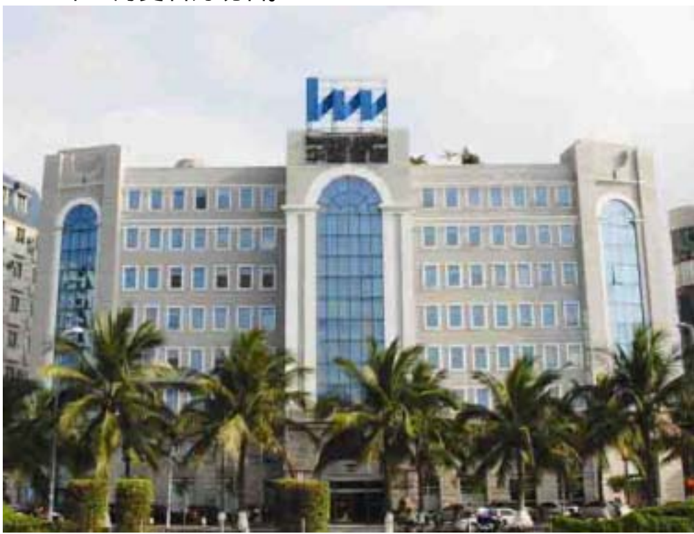
(位于海口市海甸岛的公司本部办公楼民生大厦)

华闻传媒投资集团股份有限公司，原名华闻传媒投资股份有限公司、海南民生燃气(集团)股份有限公司、海口管道燃气股份有限公司，是于1992年12月以定向募集方式发起设立的国内燃气行业首家股份制企业。1997年7月，在深圳证券交易所上网发行5,000万股A股股票并挂牌上市，开国内燃气行业企业上市之先河。1998年7月，更名为海南民生燃气(集团)股份有限公司。2006年11月，更名为华闻传媒投资股份有限公司。2008年2月更名为现名。