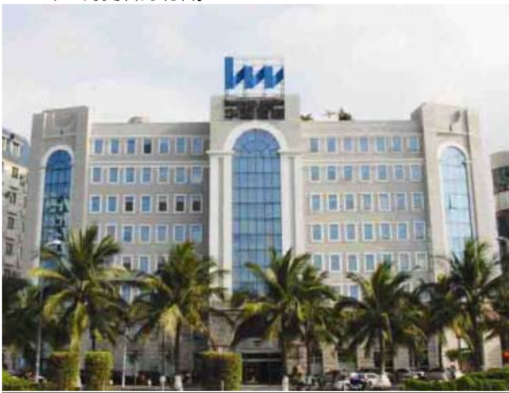
(位于海口市海甸岛的公司本部办公楼民生大厦)

华闻传媒投资集团股份有限公司，原名华闻传媒投资股份有限公司、海南民生燃气(集团)股份有限公司、海口管道燃气股份有限公司，是于1992年12月以定向募集方式发起设立的国内燃气行业首家股份制企业。1997年7月，在深圳证券交易所上网发行5,000万股A股股票并挂牌上市，开国内燃气行业企业上市之先河。1998年7月，更名为海南民生燃气(集团)股份有限公司。2006年11月，更名为华闻传媒投资股份有限公司。2008年2月更名为现名。